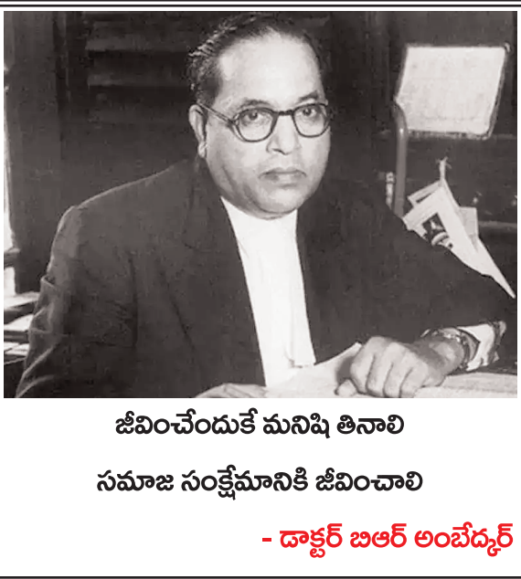
జీవించేందుకే మనిషి తినాలి సమాజ సంక్షేమానికి జీవించాలి - డాక్టర్ బిఆర్ అంబేద్కర్